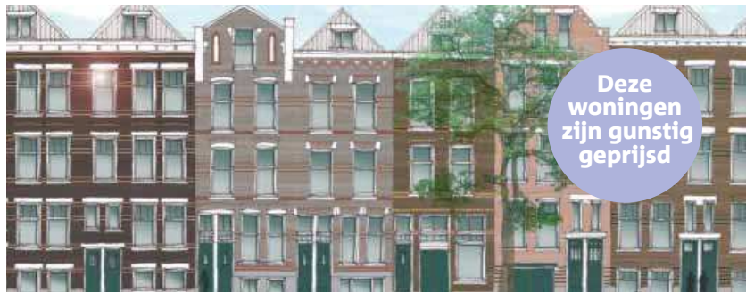
Achter de oude gevels schuilen soms originele details.